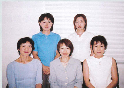
介護支援専門員スタッフ

当社では明るく活力ある社会づくりへの貢献を目指して、高齢者の在宅生活への援助、また高齢者のみならず働き盛りの年代、あるいは主婦の方々を対象に生活の質(QOL)の向上などを目標に医療・福祉サービス事業を行っております。